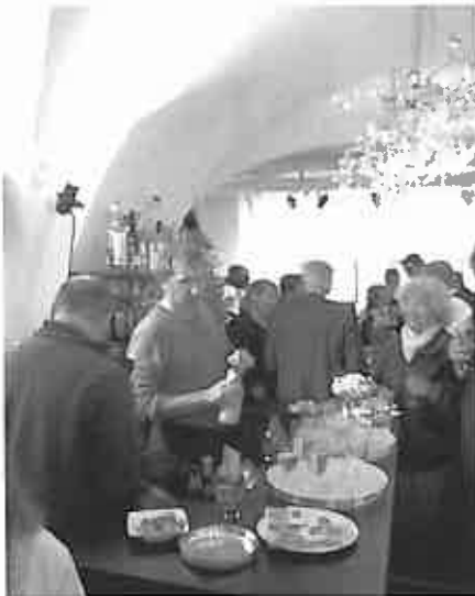
Wahlapéro im RAB

Im Gegensatz zu anderen Gemeinden ist es in Trognen gelungen, am 11. April 2010 auf Anhieb die vakanten Sitze im Gemeinderat resp. in der Geschäftsprüfungskommission wieder zu besetzen. Die SP organisierte in der RAB-Bar am Wahlsonntag einen öffentlichen Wahlapéro.