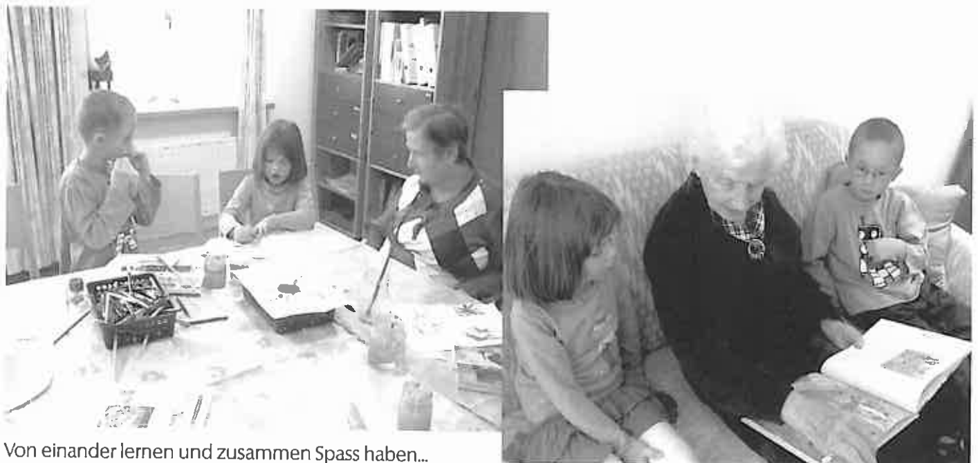
Von einander lernen und zusammen Spass haben...