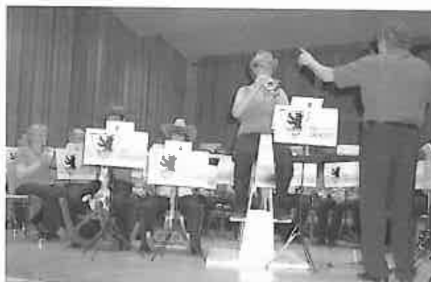
Eine der Solistinnen beim «Galop for Three»