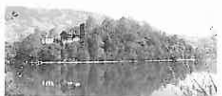
Insel Schwanau - eines der Ziele

Voranzeige: Am Mittwoch, dem 9. Juni 2010, findet ein Ausflug zur Insel Schwanau im Lauerzersee und nach Einsiedeln statt Vom Montag, dem 6. bis Freitag, dem 10. September 2010, sind Ferien geplant Reservieren Sie die Daten, Sie erhalten anfangs Mai die detaillierten Unterlagen mit den Anmeldeformularen. Kontakt: Anna Rose Schläpfer, Tel. P 071 344 32 29/ G 071 344 14 40