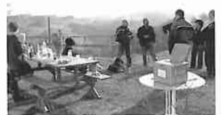
Letzter Urnengang im Garten des Wahllokals Hüttschwendi