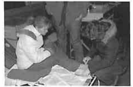
Patientin gut aufgehoben...

Die Aufgaben des Samaritervereins bestehen hauptsächlich darin, uns in Sachen Nothilfe immer auf dem aktuellsten Stand zu halten, damit wir bei grossen und kleinen Anlässen zuverlässig Postendienst leisten können.