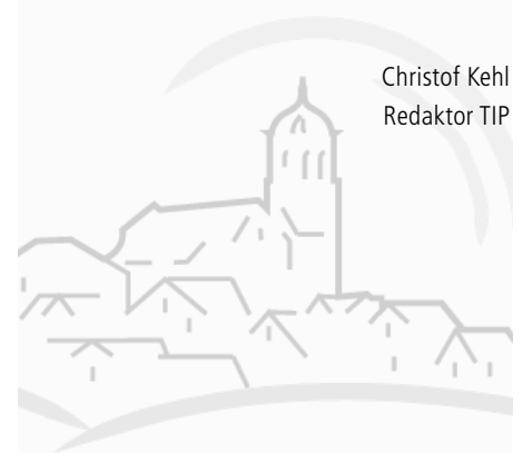
Christof Kehl Redaktor TIP

Ich glaube, hier ist unser Umdenken und Nachdenken gefragt! In diesem Sinne wünscht Ihnen die Redaktion eine beschauliche und schöne Adventszeit.