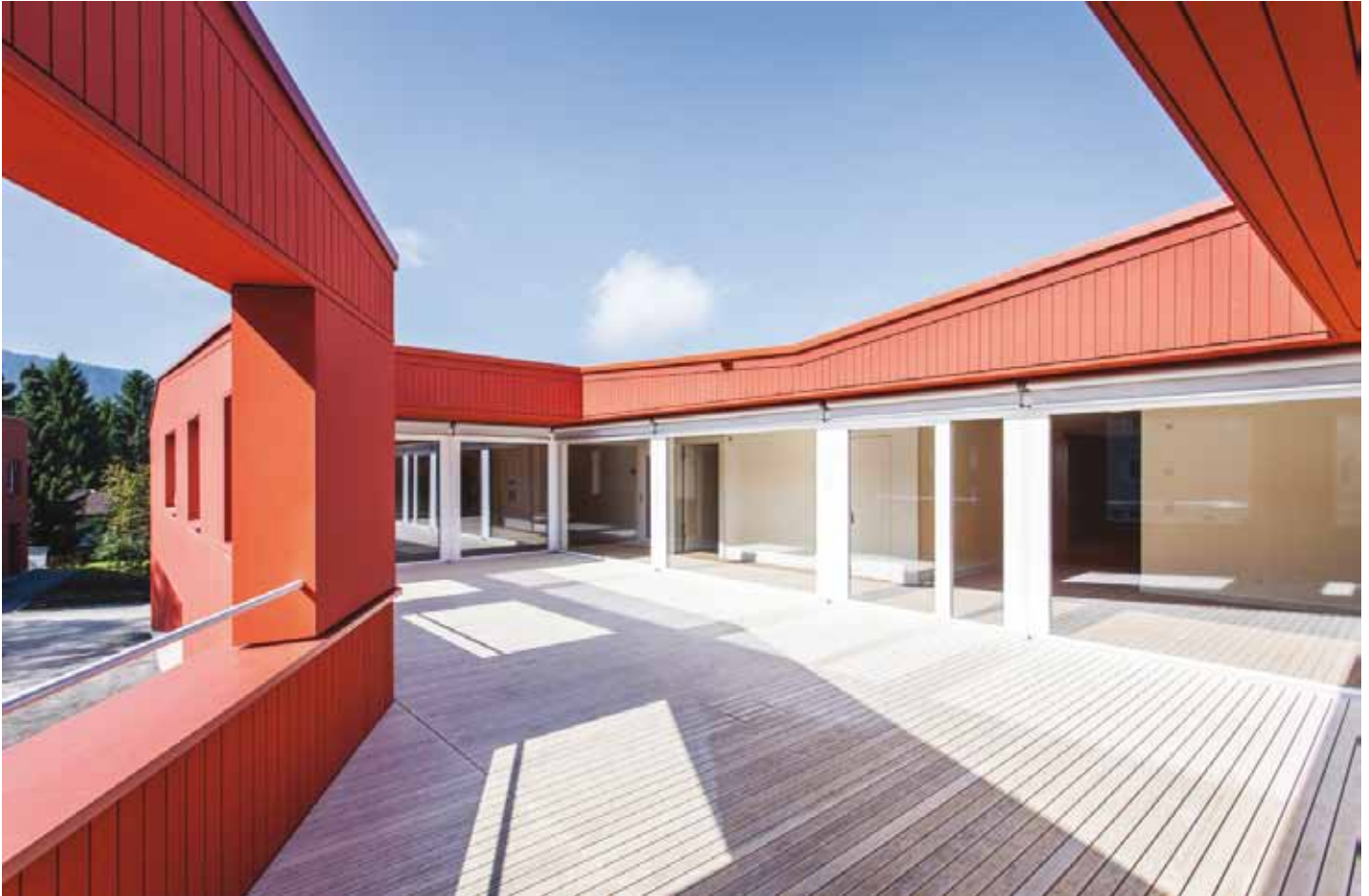
▲ Die Terrasse

Voller Freude konnten wir im Werkheim nach einer Bauzeit von 16 Monaten anfangs September mit dem Einziehen in die Neubauten beginnen.