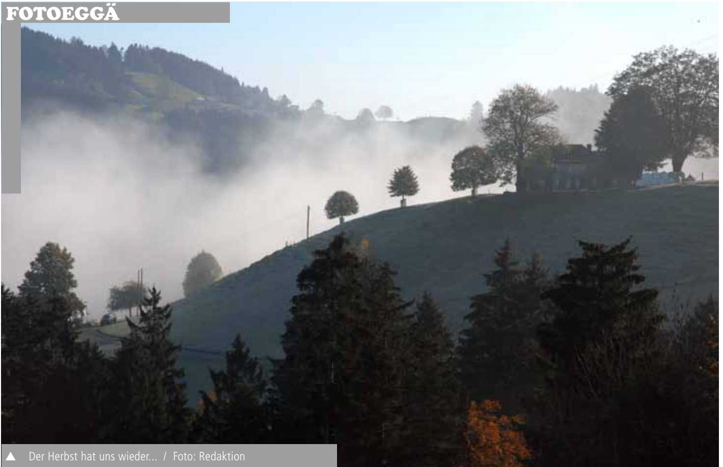
▲ Der Herbst hat uns wieder...