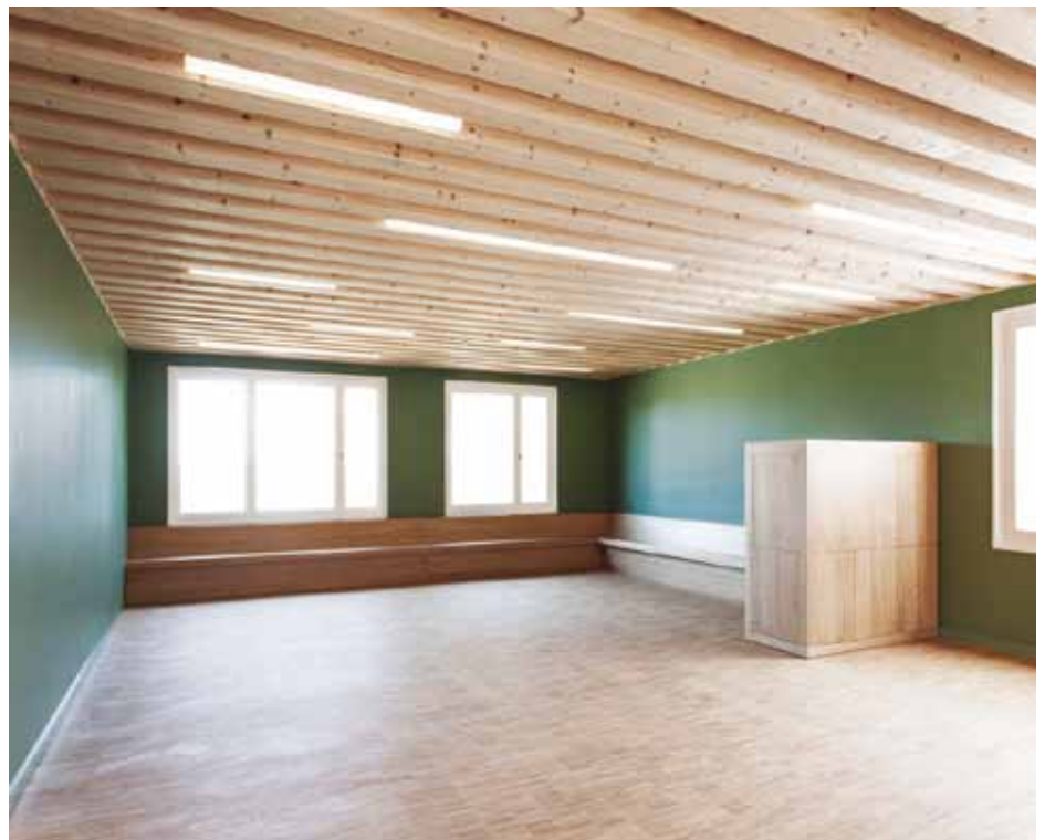
► Der Speisesaal